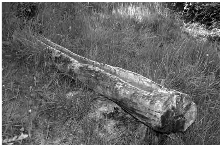
Bassi a la font del Manyano, dalt a Montsant (2008)

Les professons de pregàries sortien de l'església i s'anava, arrengrerat i amb les atxes enceses, cantant, fins als Hostalets. Allí –com s'acostumava a fer en aquest tipus de romiatges– l'estructura de la professó es desfeia i tothom enfilava, camí amunt, cap a Montsant. 19 En arribar al capdamunt del grau es tornava a muntar la professó fins a l'ermita.