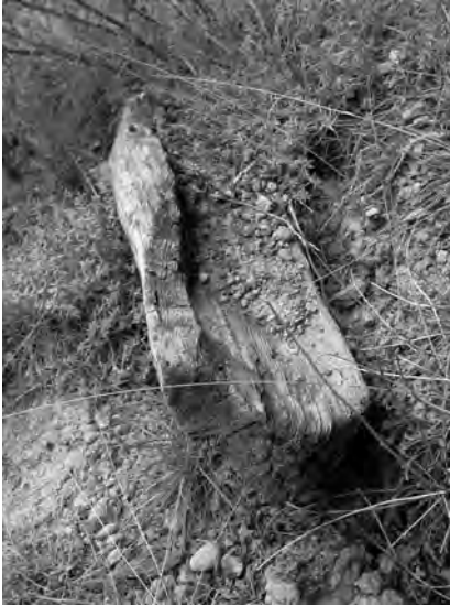
Restes d'un antic bassi a la font del Teix

en el seu interior, disposats longitudinalment, de forma que el goteig anava omplint el primer i aquest, un cop ple, vessava cap al segon, i així successivament. D'aquesta forma, amb cabals molt petits s'aconseguia disposar d'una certa quantitat d'aigua per al consum de persones o com a punts d'abeurada per al bestiar. Els bassis, obrats pels pastors, van continuar en ús fins a temps ben recents, tot i que, molts cops, els troncs de fusta van ser substituïts per bidons metàl·lics tallats per la meitat. En els últims anys s'han recuperat els bassis de fusta en alguns indrets. 22